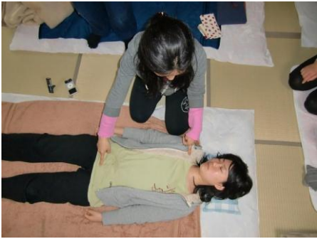
(3) 左中指は「右腕の付け根」、右人さし指は「恥骨」