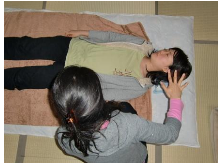
(14) 右手を広げ上半身のオーラを掌で左回しに捻げる