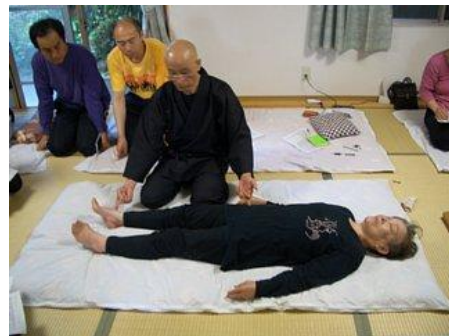
(8) 左中指は腰、右人さし指は「くるぶしの下」