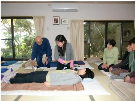
(5) 右手を広げ上半身のオーラを掌で左回りに捻げる