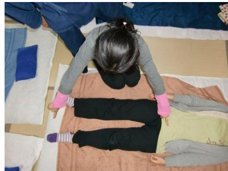
(6) 左中指は「恥骨」、右人さし指は「足と足の間、くるぶし付近の中空をタッチ」