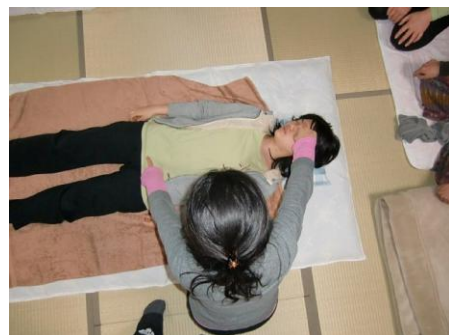
(10) 体の反対側に回って同じようにする。 左中指は「恥骨」、右人さし指は「額」