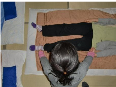
(17) 左中指は「くるぶしの下」、右人さし指は「腰」