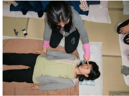
(4) 左中指は「額」、右人さし指は「腰」