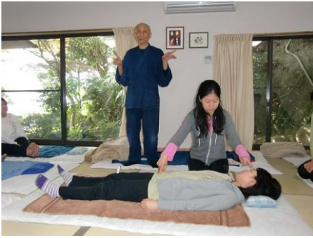
(1) 左中指は「額」、右人さし指は「恥骨」