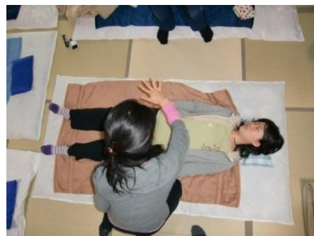
(18) 右手をひろげ下半身のオーラを掌で左回しに捻げる