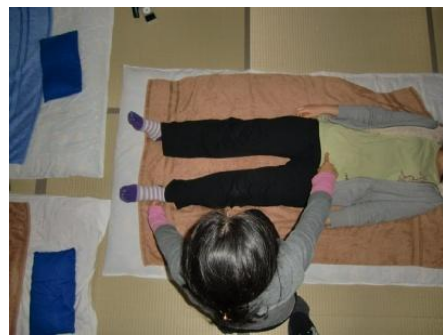
(16) 左中指は「くるぶしの下」、右人さし指は「恥骨」