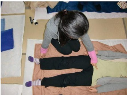
(7) 左中指は恥骨、右人さし指は「くるぶしの下」