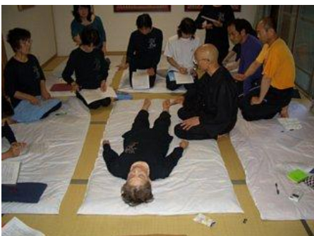
(9) 右手をひろげ下半身のオーラを掌で左回りに捻げる