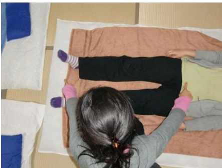
(15) 左中指は「足と足の間、くるぶし付近の中空をタッチ」、右人さし指は「恥骨」